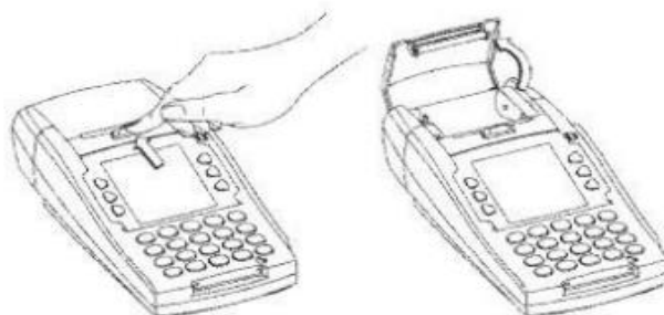
Abriendo el compartimiento del rollo de papel