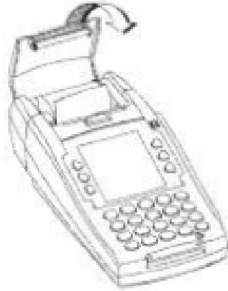
Controla el funcionamiento del ciclo de papel